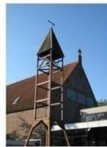
St. Augustinus Vijfhuizen