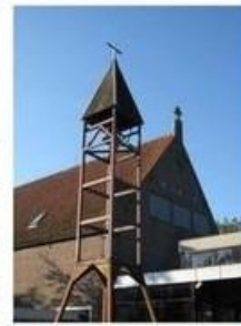
St. Augustinus Vijfhuizen