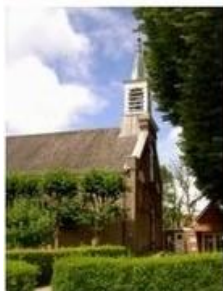
St. Jacobus de Meerdere Haarlemmerliede