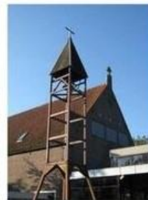
St. Augustinus Vijfhuizen