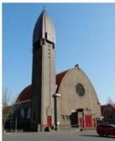
O.L.V. Geboorte Halfweg