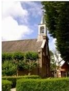
St. Jacobus de Meerdere Haarlemmerliede