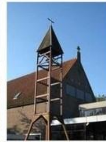
St. Augustinus Vijfhuizen