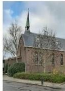
St. Adalbertus Spaarndam