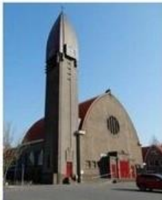
O.L.V. Geboorte Halfweg